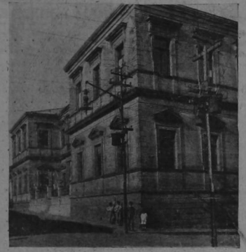
Colegio de Señoritas. Local en donde funcionará el Instituto Comercial y Academia Inglesa, generosamente cedido por su digna Junta de Gobierno.